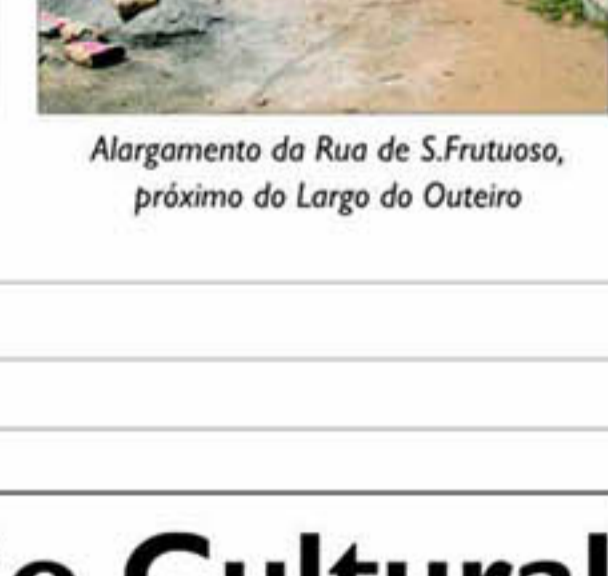
Alargamento da Rua de S. Frutuoso, próximo do Largo do Outeiro