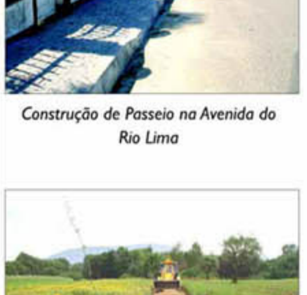
Construção de Passeio na Avenida do Rio Lima