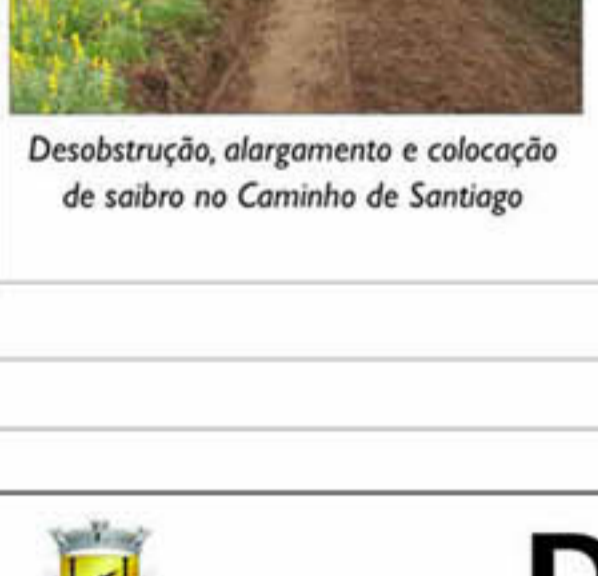
Desobstrução, alargamento e colocação de saibro no Caminho de Santiago