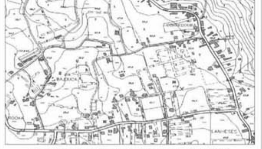
Mapa com identificação das vias gravado em CD-R