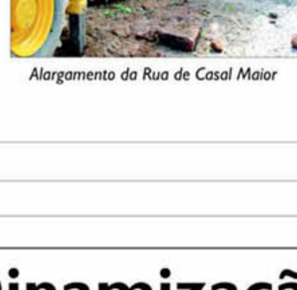
Alargamento da Rua de Casal Maior