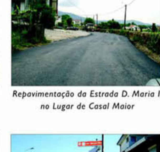
Repavimentação da Estrada D. Maria I, no Lugar de Casal Maior