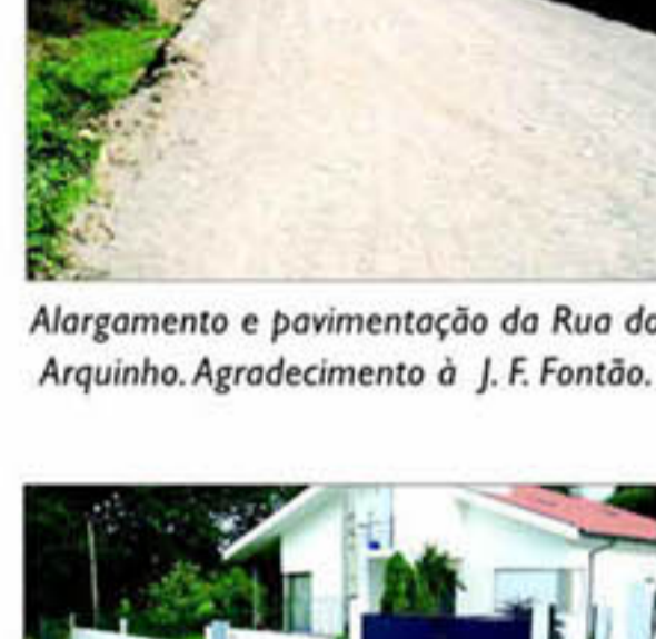
Alargamento e pavimentação da Rua do Arquinho. Agradecimento à J. F. Fontão.