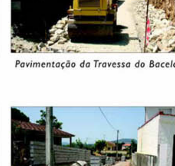
Pavimentação da Travessa do Babelo