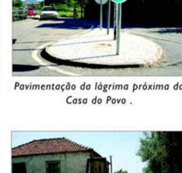
Pavimentação da lágrima próxima da Casa do Povo.