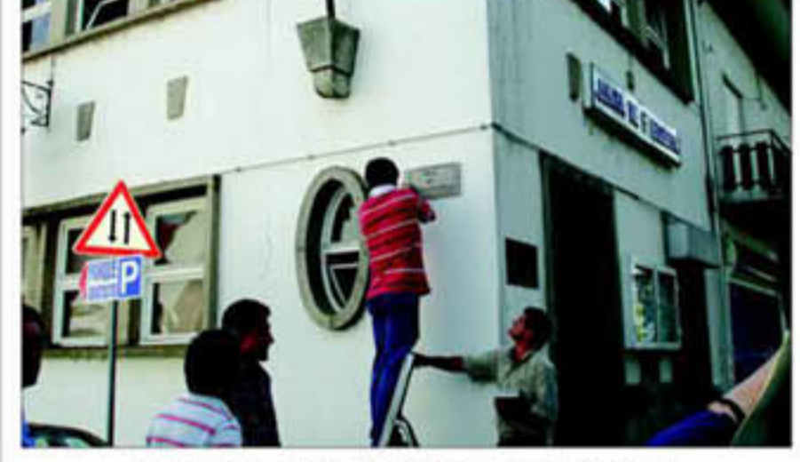
Acto cerimonial de colocação da 1ª Placa