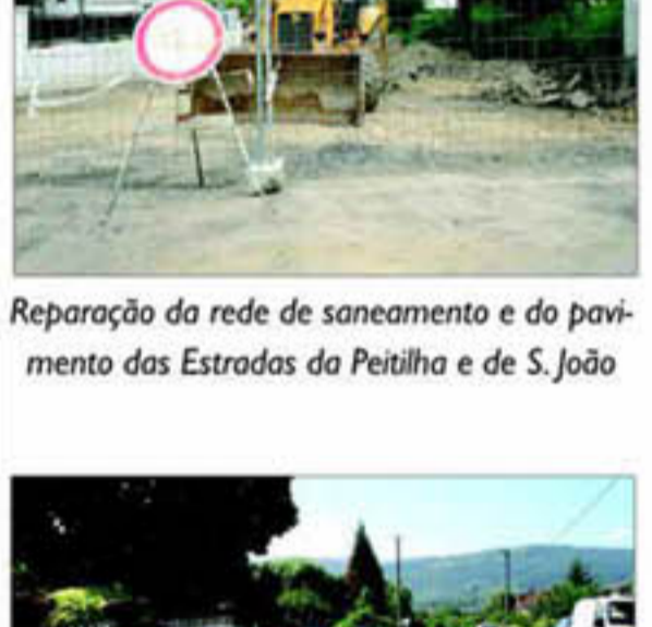
Reparação da rede de saneamento e do pavimento das Estradas da Peitilha e de S. João