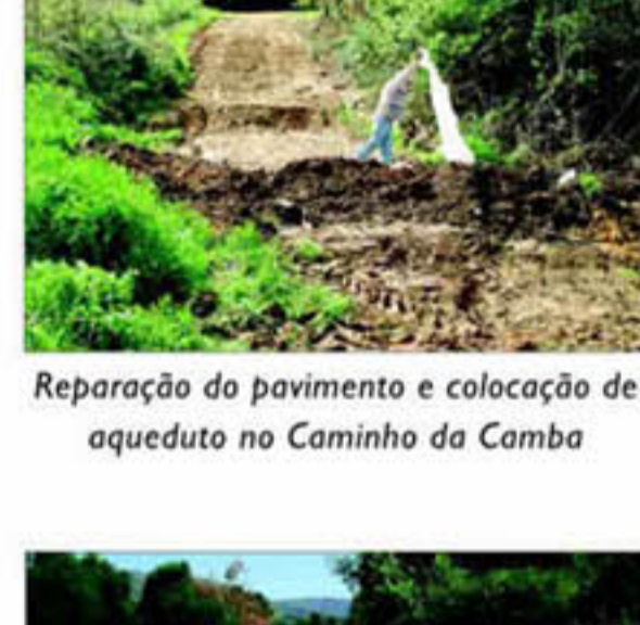
Reparação do pavimento e colocação de aqueduto no Caminho da Camba

Embora se continue a proceder ao pagamento regular da elevada dívida existente, em 2007, até final do mês Julho, realizaram-se mais obras e melhoramentos a nível da rede viária, águas pluviais e arranjos urbanísticos. Só foi possível com bastante esforço financeiro da Junta e, nalguns casos, com o total patrocínio da Câmara Municipal e dos SMSBVC.