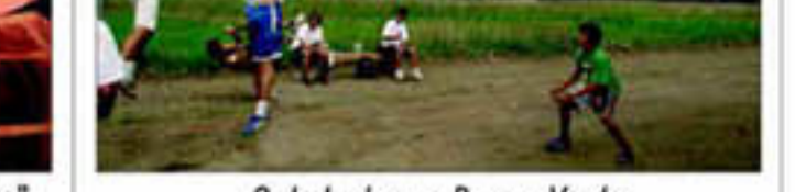
9 de Junho, no Parque Verde