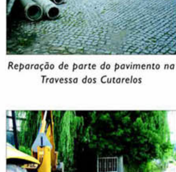
Reparação de parte do pavimento na Travessa dos Cutarelos