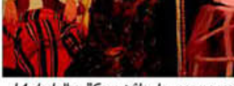
14 de Julho, "Com pêlo do mesmo gato"